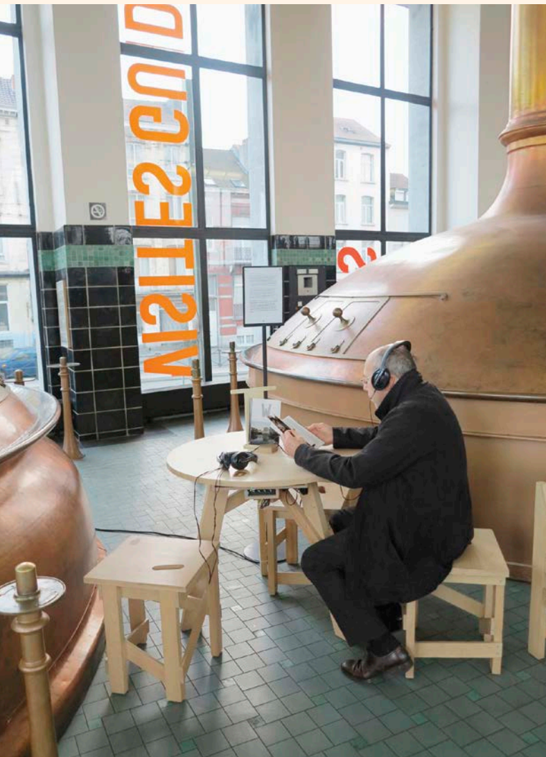
ZimmerFrei, W , installation sonore dans le hall d'entrée du WIELS/sound installation in the Lobby of WIELS, 2013.

accounts BNA-BBOT has collected are archived in a database along with a compilation of sounds of the city. All of these soundtracks are made available to the community, and artists can use them as creative material.